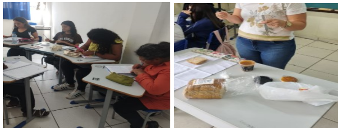
Figura 2: Momento dos estudantes na atividade montando um sanduíche

não poderia modificar nenhum procedimento, devendo seguir fielmente as orientações estabelecidas pelos colegas.